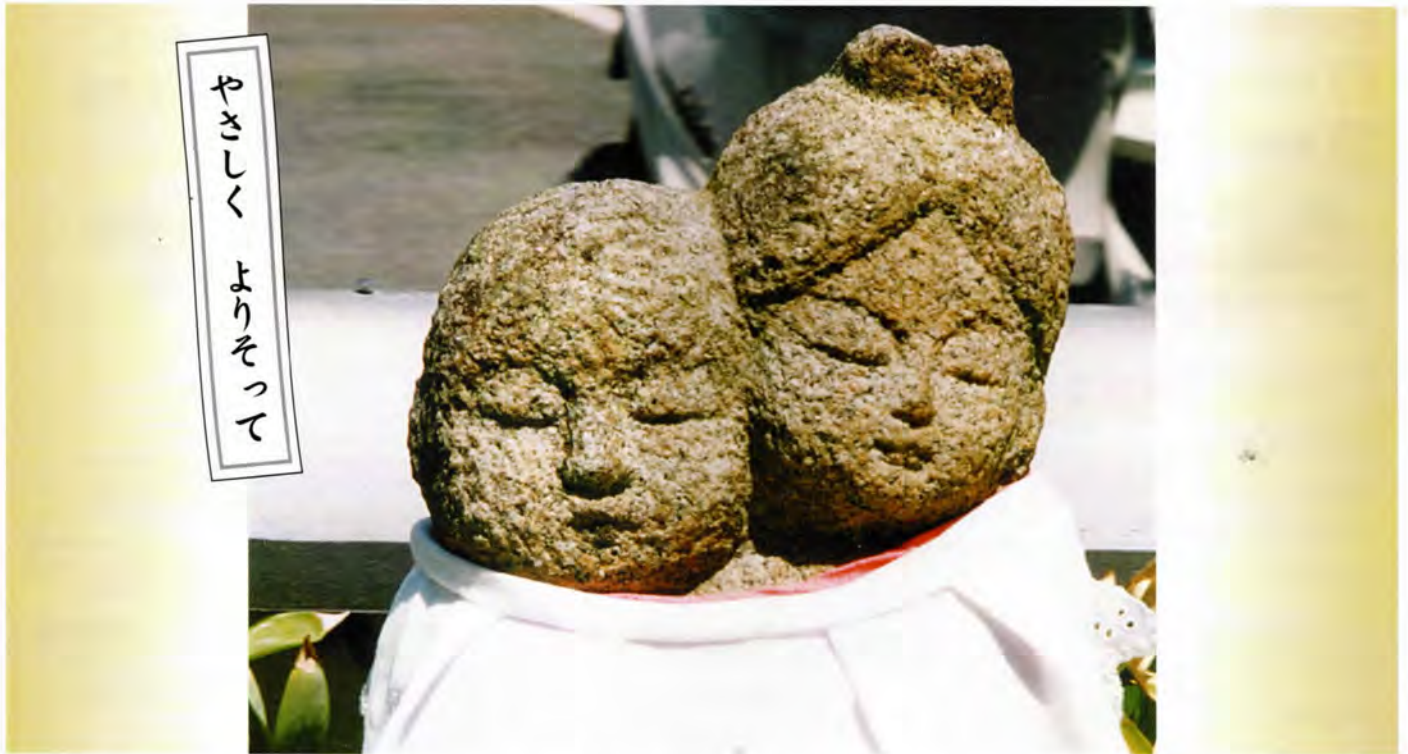
やさしく よりそって

山田学区は、高齢化率が草津市内二位となっています。そこで、先ずはひとり暮らし高齢者の方々にこの「安心のバトン」を民生・児童委員及び学区社協福祉委員が訪問し、お渡し致します。 「もしも…」の時に備える「安心のバトン」に記載された内容は、自己管理とし、外部には一切漏れません。 ひとりになっても安全で安心して暮らせる様、学区全体で取り組みをしていきます。