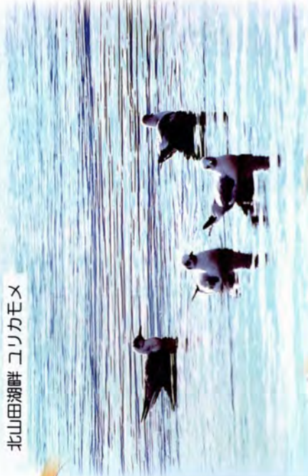
北山田湖畔 コリカモメ