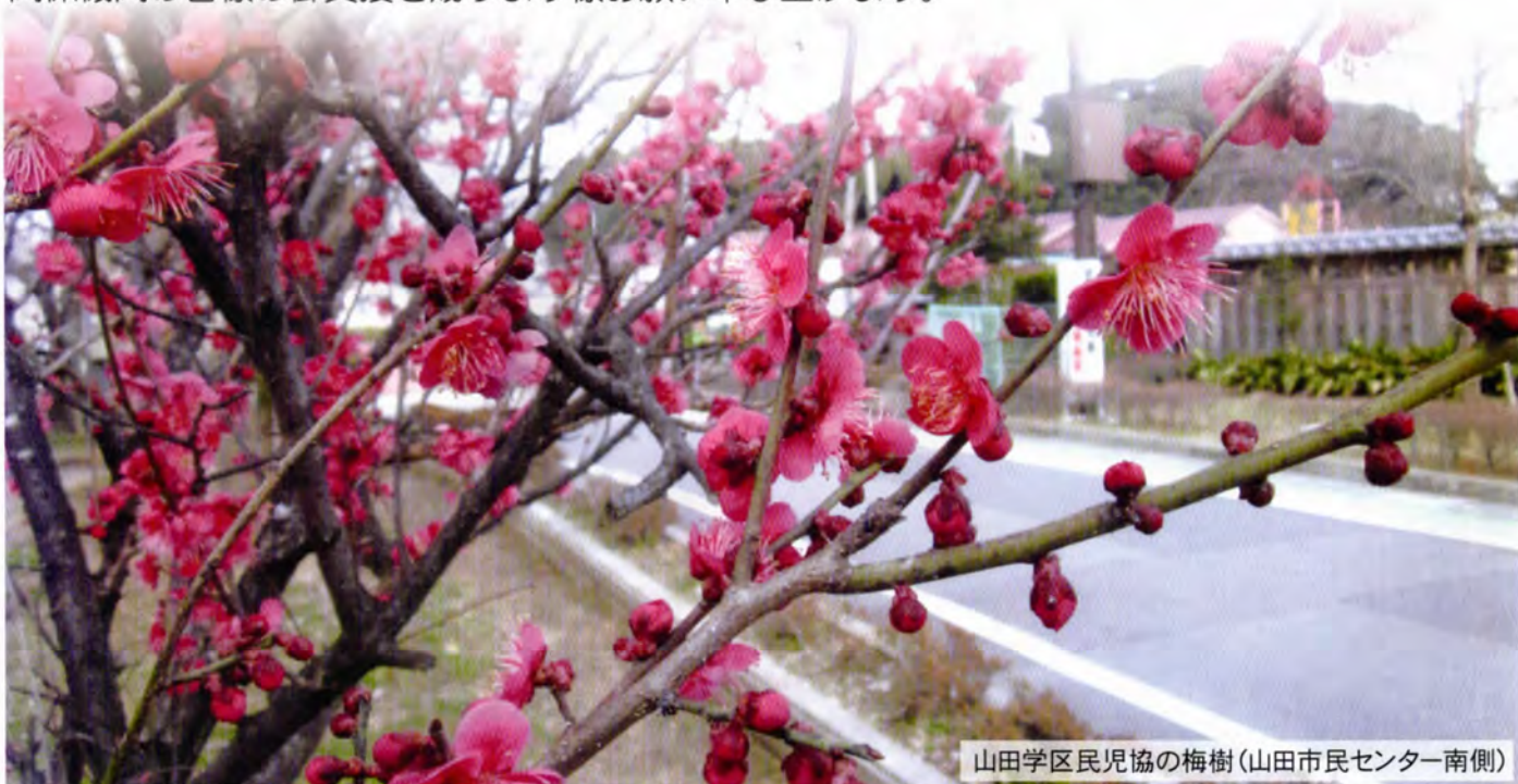
山田学区民児協の梅樹(山田市民センター南側)

終わりに、今年度は民生委員制度創設100周年と記念すべき年です。この時の流れの中に置かれている巡り合わせと、次世代に繋げなければならない責務とを感じております。どうぞ地域・関係機関の皆様の御支援を賜ります様お願い申し上げます。