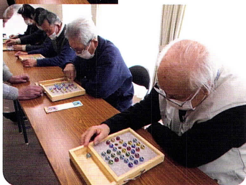
ゲーム オンリーワン